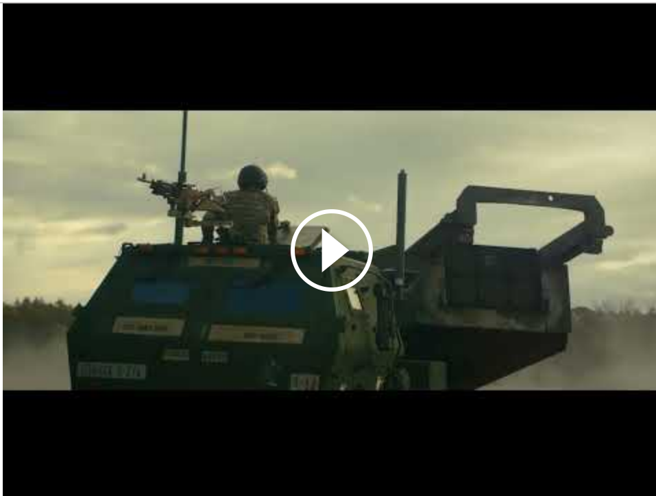
"En Vez De Eso" video de 30 segundos de la campaña "Decide to Lead" del Army. Sáltate la posición de principiante. Decide liderar como Oficial del Army.